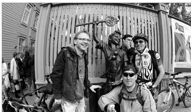
Участники велосипедной экскурсии «Литературное движение»

В ходе фестиваля при участии спортивно-туристического клуба «Вело-Самара» впервые состоялась велосипедная экскурсия «Литературное движение». Участники посетили разные литературные памятники Самары, проехали вдоль улиц и скверов, названных в честь знаменитых литературных деятелей. Маршрут, начало которо-