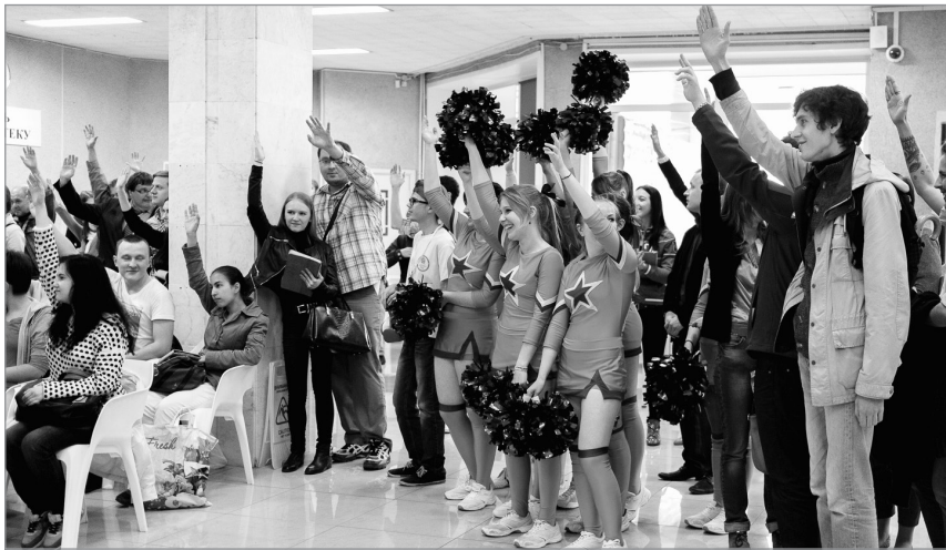
Голосование — определение победителя «Большого поэтического ринга»