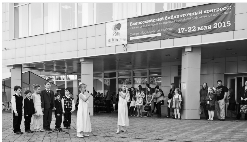
Выступление детских коллективов на открытии Летнего читального зала

Торжественное закрытие Самарского литературного фестиваля проходило при поддержке сетевого радио «Время Звучать!». Завершился фестиваль концертом, объединившим ритмы творческих коллективов города. Вместе с поэтами свои стихи и песни представили самарские музыканты: